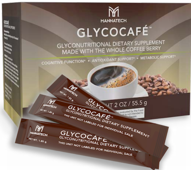
Los productos mostrados son productos de EE. UU.