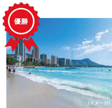
GI旅行特典チーム招待 (3名1組)