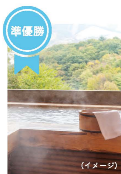
高級温泉旅行 (3名1組)